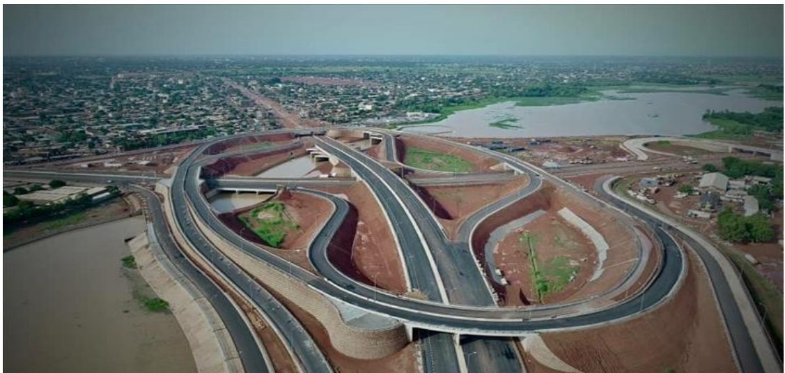
Échangeur du nord de la ville de Ouagadougou