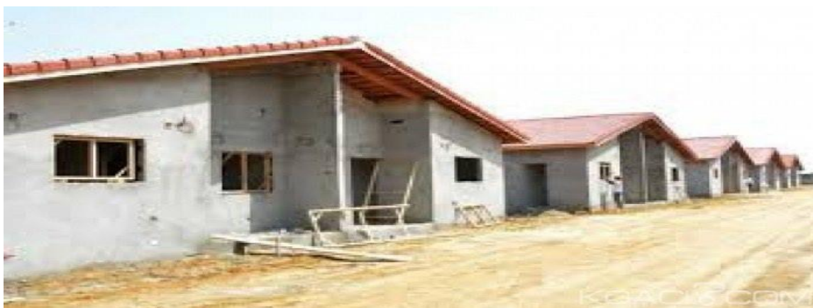
« Logement social pour tous »