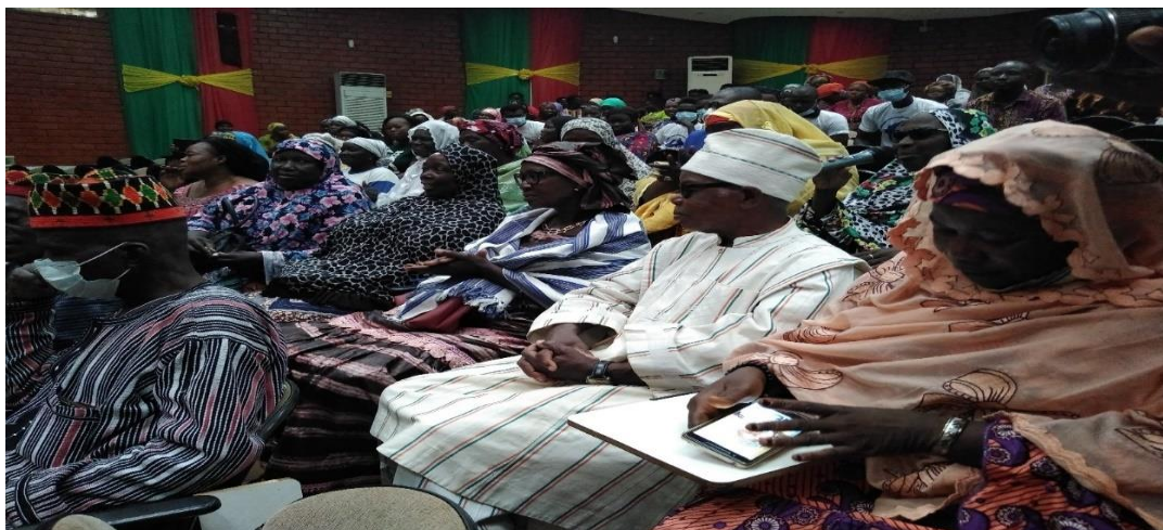
« La Solidarité entre les génération »

La sécurité sociale vise à donner des moyens d'existence à tout individu, quelle que soit sa classe sociale. Elle se doit de soulager les besoins de bases de cet individu : s'alimenter et se soigner. Elle doit aussi venir en aide aux personnes lorsque celles-ci n'ont plus de revenus suffisants suite à la perte de leur emploi ou parce qu'elles sont trop âgées pour travailler.