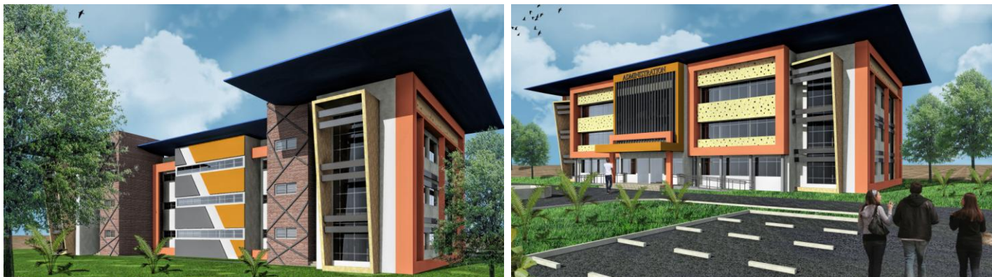
Quelques images du bâtiment Administratif

l'aménagement du site. Aussi nous avons proposé des façades protégées afin d'avoir un meilleur confort pour les utilisateurs et réduire au maximum l'utilisation de l'énergie électrique. Une station d'épuration est prévue pour les traitements des eaux usées des différents bâtiments et leur réutilisation pour l'arrosage des plants et l'alimentation des chasses des toilettes. Nous avons proposé l'utilisation de panneaux solaires pour assurer l'éclairage extérieur. L'utilisation des patios par endroit permet la création d'un micro climat avec un confort naturel pour le bien être des utilisateurs.