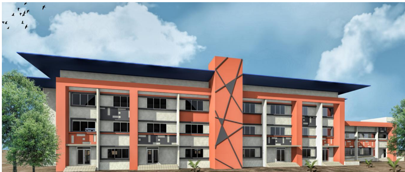
Vue sur le bloc pédagogique